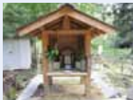
山頂に残る観音堂跡