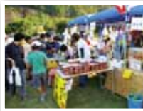
9月 わたらいフェスタ in 鏡