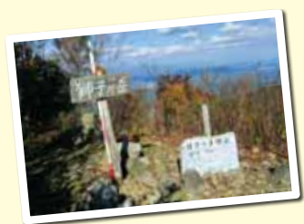
獅子岩からも雄大な景色が楽しめます。