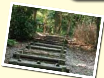
日の出の森ルート登山道