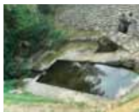
東出の井戸（弘法の井戸）

田口地区には、県道北側に位置し、その昔弘法大師が杖をついて出された霊泉とされる「東出の井戸」があります。また、県道南側にも「中西の井戸」と呼ばれる湧水があり、両方とも夏は冷たく、冬は温かい水が湧き出しています。現在も地元の人々に管理され、大切に利用されています。