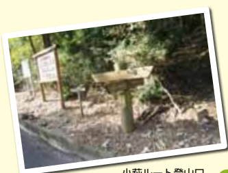
小萩ルート登山口