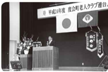
度会町老人クラブ連合大会

功労賞、長寿者表彰を受けられた皆さん、おめでとございました。お元気で、これからも知恵を授けてください。