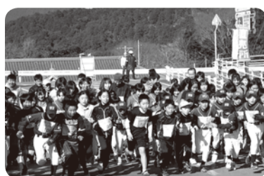
宮リバー度会パークジョギング大会