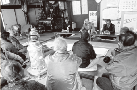
前回の『ふれあいトーク』の様子

今回の時間帯は平日夜間とし、中川地区から順に、各地区・自治会の公民館や集会所において、2時間程度の座談会形式で行います。 参加は自由ですので、男女を問わず幅広い年齢層の方々から、たくさんのご意見、ご要望をいただきたいと考えていますので、お問い合わせの上、ぜひご参加ください。 開催日時は、各区・自治会長と調整して、広報紙や町ホームページ、CATV文字放送(わたらいちゃんねる)でもお知らせしますが、公務の都合などにより、やむを得ず予定を変更する場合がありますので、あらかじめご了承ください。 ※平成28年3月29日までの日程は、以下のとおりです。