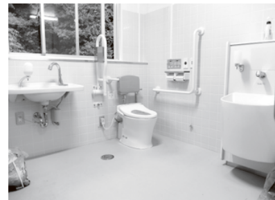
度会小学校 2階多目的トイレ