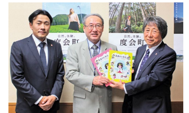
大西社長(左)と大西会長(右)

寄付していただいた絵本は、町内保育所・小中学校、南伊勢高校度会校舎、わたらい特別支援学校に配布され、町中央公民館・地域交流センター図書室で読むことができます。