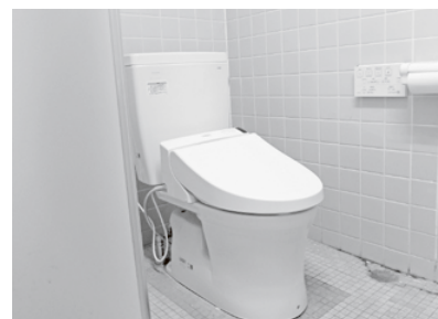
度会中学校 3階男子トイレ