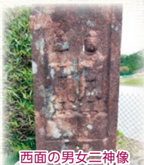
西面の男女二神像