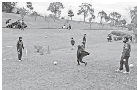
町内では縁遊祭に参加!

【問合せ先】FC.ISE-SHIMA事務局 ☎0599-43-0008 ☎0599-65-7866 ✉information@fc-iseshima.org ホームページ http://www.fc-iseshima.org/