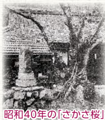
昭和40年の「さかさ桜」