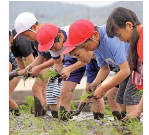
丁寧に植える児童たち