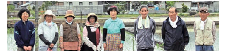
ご協力いただいた皆さん

今後は稲の成長を観察し、秋に稲刈りを体験する予定です。また、11月には、『度会小フェスタ』で、収穫したもち米を児童たちが販売する予定です。