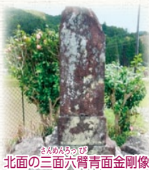
北面の三面六臂青面金剛像