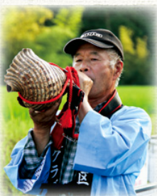
ほら貝を吹く大人

立岡地区では、地元有志の呼びかけで、古き良き農村の風景と昔の百姓の心意気を肌で感じるとともに、今の子どもたちに日本の食文化の豊かさを知ってもらうため、平成27年から「虫送り」を復活しました。例年6月下旬に行われており、今年は6月23日(日)の夕方に開催を予定しています。