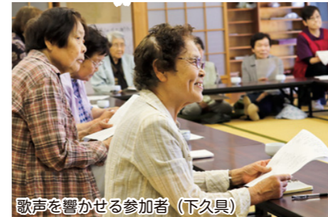
歌声を響かせる参加者(下久具)