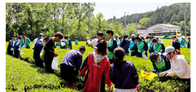
新茶を収穫する生徒たち