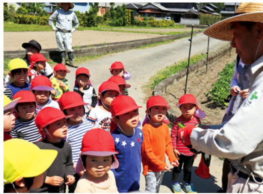
エンドウの取り方を説明