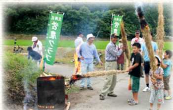
たいまつに火をともし子ども