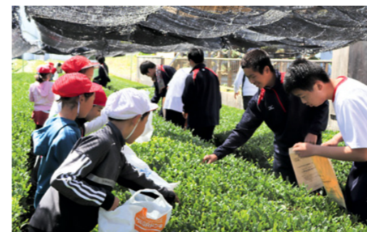
協力して摘み取る子どもたち

摘み取った茶葉は、町茶業組合研修工場で製茶されたあと、両校に届けられ、児童・生徒たちは香り高い新茶を味わいました。