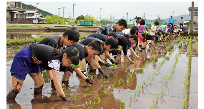
列に沿って植える子どもたち

今後は稲の成長を観察し、秋に稲刈りを体験する予定です。また、11 月には、『度会小フェスタ』で、収穫したもち米を児童たちが販売する予定です。