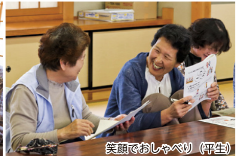
笑顔でおしゃべり(平生)

地 域で生き生きと暮らすことができるよう、仲間づくりや健康づくりのため、気軽に立ち寄れる集いの場として平成29年に始まった『寄ってこカフェ』。気心の知れた人同士が、体操やゲーム、食事やおしゃべりなどを通じて楽しい時間を過ごします。 運営は地域のボランティアが主体的に行っており、現在各地区で18の寄ってこカフェがさまざまな活動を行っています。スタッフも、参加者の皆さんと一緒に楽しみながら取り組み、支え合う地域づくりのために活動しています。 みんなで集まることで「外に出て体と頭を動かすこと」「人とつながること」「地域での役割を担うこと」となり、人もまちも健康で幸せに過ごしていくために大きな役割を果たします。 町も集いの場を増やし、活発にしていくため、随時相談に応じるなど、活動を支援しています。