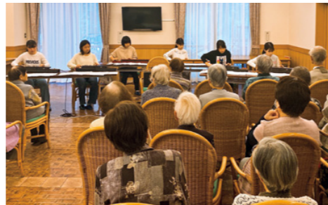
子どもたちの演奏を聴く入居者の皆さん

当日は約 20 人が集まり、食堂で演奏を楽しみました。入居者の皆さんは、独特の音色の演奏にすっかり引き込まれ、1曲終わるごとに大きな拍手を送っていました。