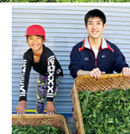
収穫を前にした笑顔