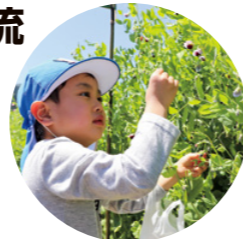
手を伸ばそうとする園児

取れたエンドウを見て、「いっぱいとした!」「お母さん喜ぶかなあ」と園児たちは大満足。お世話になった皆さんに元気よくお礼を言って、各家庭に持ち帰りました。