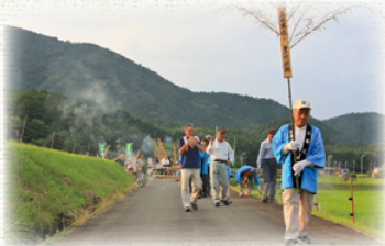
お札を先頭にした行列

立岡地区では、地元有志の呼びかけで、古き良き農村の風景と昔の百姓の心意気を肌で感じるとともに、今の子どもたちに日本の食文化の豊かさを知ってもらうため、平成27年から「虫送り」を復活しました。例年6月下旬に行われており、今年は6月23日(日)の夕方に開催を予定しています。