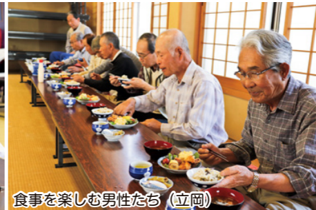
食事を楽しむ男性たち(立岡)