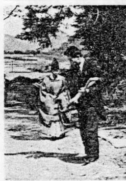
写真は、大野村の農人