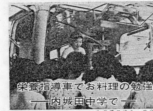
栄養指導車でお料理の勉強 —内城田中学で—