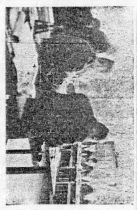
3月定例村議会メンバー

▲建設物の処分について 昭和34年度建設費計(建設 18万)が不足したため、建設費 18万とすもの。 ▲工事の執行について 昭和36年度において本村工事を 次のとおり執行しようとする。 1. 事業額 村道1000000円 ▲昭和34年度農会村繰入繰出決算 の承認について 歳入額(7千7百11万7千78 円) 歳出額(9千122万8千8 百96円) 繰り不足額(1千3 百50万4千155円) 繰り 不足額は、翌年度繰入繰出額上亦 用金で補てんされました。 ▲昭和34年度農会村国民健康保 険特別会計繰入繰出決算の承認に ついて 歳入額(1千1百87万7千8 百47円) 歳出額(1千96万 4千1百54円) 繰り不足額(9 1万4千439円93分) 繰 り不足額は、翌年度繰入繰出 額で補てんされました。 ▲昭和34年度農会村国民健康保 険特別会計繰入繰出決算について 歳入額(66万9千2百43円) 歳出額(12万6千9百26円) 繰り不足額(54万2千47分) ..... 翌年度繰入繰出額