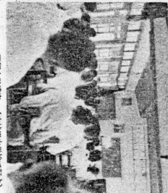
夏期大学講座 (内城田中学校で写真)

後藤・田中両氏の講演要旨 これからの農業と農村生活 ●日本の農業、農村生活の現状 ●農業近代化の意義 ●農村生活の改善 ●農業と農村の発展