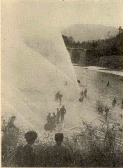
新年恒例の出初式は、1月7日内城田中学校々々庭で、消防団員、来賓約1百60名、消防ポンプ20台が参加して午前十時開式、盛大に行なわれました。

の申告は役場へ 道路運送車輛法の改正で、農耕作業用自動車は、小型特殊自動車となり申告、標識交付事務は市町村役場で取扱います。