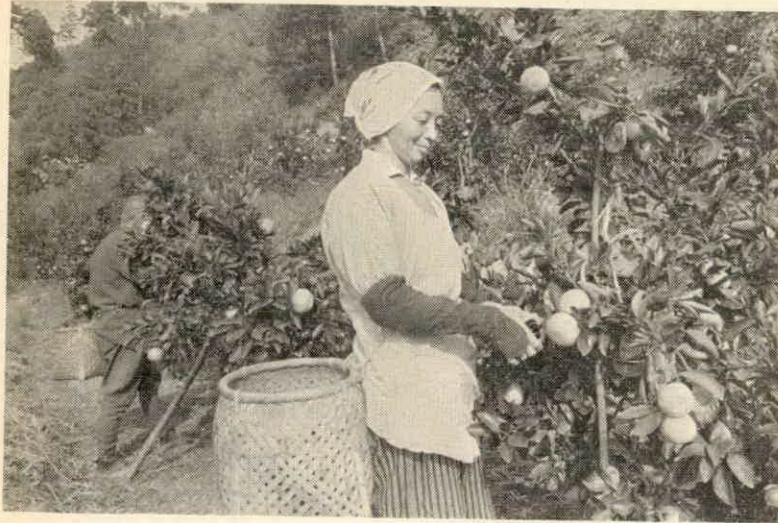
みかんの収穫（中之郷で写す）

日一日と深まりゆく秋の日ざしをうけて、ここ、中之郷では、温州みかんが、すっかり色づき、収穫に忙しい。 みかんといえは、五ヶ所（南勢町）や佐奈（多気町）が産地ですが、本村でも、昭和三十七年から、本格的に栽培されるようになり、ことしは、それらの幼木が、やっと実をつけた。