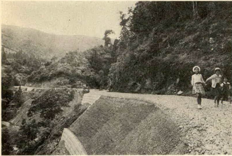
完成した五ヶ町線林道

この工事は、伊勢市高島建 を投じて完成されたもので、設の施工で一千二百五十万円 中員三・六割、延長一、五五