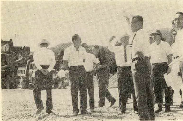
砂利採取現場を視察する県議会土木常任委一行

たものだが、現地を見て回った。これはひどいと、もらして一行は、砂利を満載したダンプカーが、土煙りを上げて疾走するなかを、少さくなく、村内の宮川流域での砂利採取現場を見て回った。これはひどいと、もらして一行は、砂利を満載したダンプカーが、土煙りを上げて疾走するなかを、少さくなく、村内の宮川流域での砂利採取現場を見て回った。