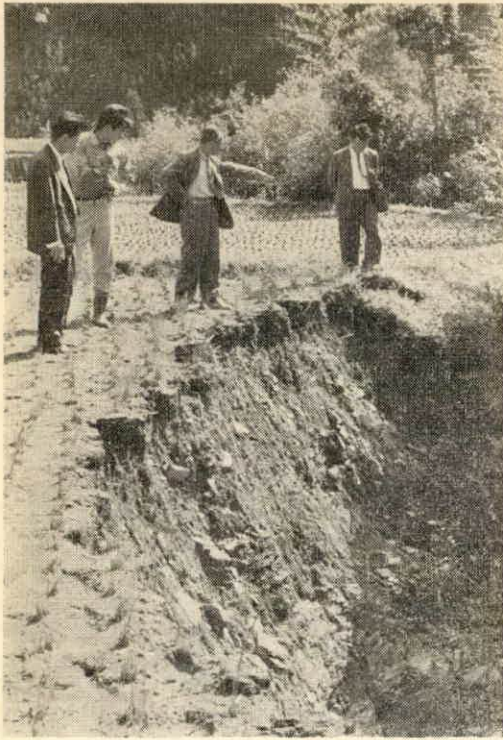
決壊した田んぼ (注連指で写す)

九月十日に本土に上陸した台風23号、それに追い打ちをかけるように本土を襲った24号、25号は各地で猛威をふるった。ことに志摩半島をかすめ、東北を縦断した24号は、各地に大きなツメ跡を残していったが、度会村内でも河川や農作物にかなりの被害をうけた。 この台風は、前ぶれの豪雨がひどかったが、本庁の雨量計は、一七〇ミリの雨量を示し、宮川や一之瀬川が近年にない増水で流域の耕地五〇ヘクタールが冠水したほか、河川の決壊や橋梁の流失などが目立った。刈り取りを前にしていただけに、冠水、倒伏の被害は大きく、長原地内の北園地区などでは、水田一面がゴミと流木で埋り、稲の姿が見えないところもあり、手のつけられないありさまだった。また、桑も泥などをかぶり