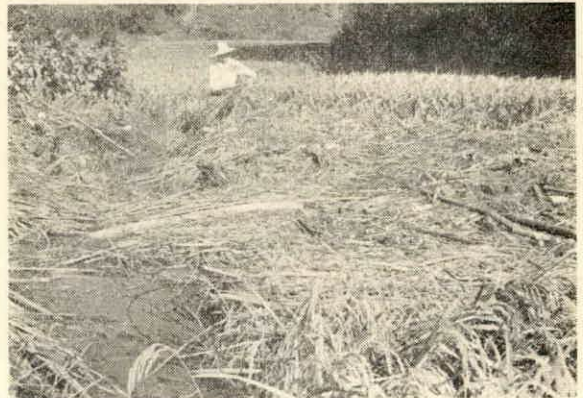
ゴミや、流木で稲もめちやめちや (長原で写す)

の被害総額は一、二〇〇万円にもなった。村では、関係機関にその状況をいち早く報告し、河川などの災害復旧を陳情している。