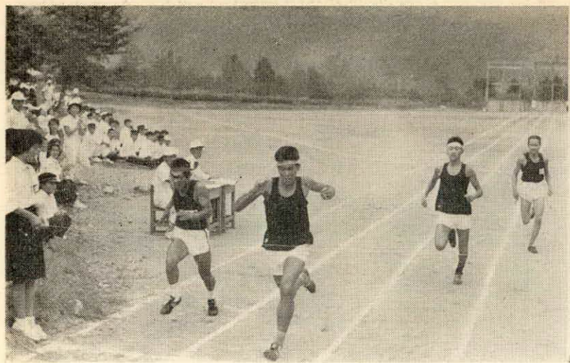
男子100メートル、ゴール前の接戦