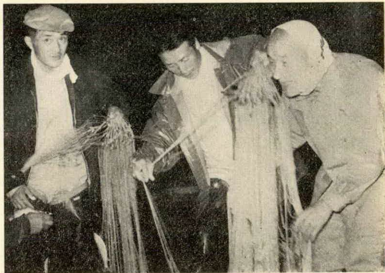
コダカ網にかかった初アユ(六月一日午前零時すぎ上久具で)

が行なわれました。川一面に張られた網がたぐり上げられて行くたびに、舟の上に初アユがひらめき夏の風物詩がくりひろげられました。