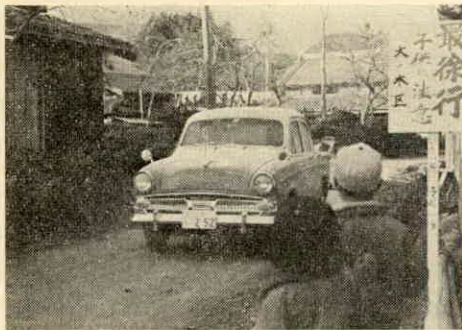
危険箇所を立てられた交通安全立札