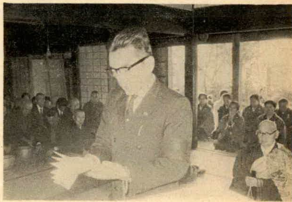
祭文を読む浜岡町長