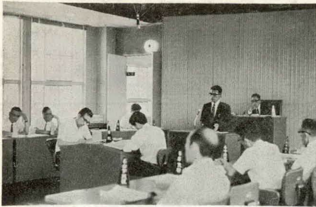
審議がくりひろげられる定例町議会