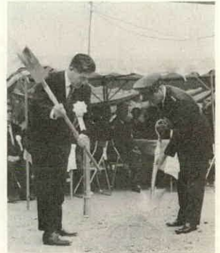
起工式でクワ入れをする清水県土木部長(左)と榎明航空学校長

この区間の工事完成は六月末の予定ですが、残る二・三の起工式が、玉城町地内の現される予定で、二・三年後には全線七の立派な道路が完成し、国道二十三号線や計画の中の南勢バイパスに直結する主要道路として期待されています。