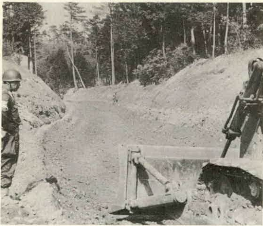
陸上自衛隊101建設大隊の誇る機械力でどんどん改良される県道度会玉城線 (岩坂峠付近で)