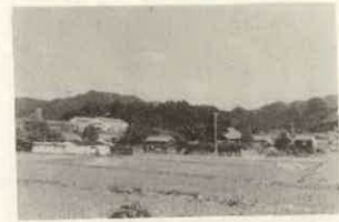
現在の一之瀬城跡