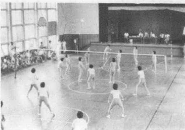
(それ ワン・ツ・スリー)

度会町体育協会主催、度会町婦人連絡協議会、度会町教育委員会、度会町後援の「第二回家庭婦人バレーボール大会」は、去る八月三十一日