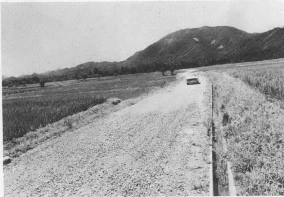
▲写真は五十年 度で整備な った 農道(牧戸地内)

この農道は、町長山下の施設方針が強く打ち出されています。なお、可決された議案の概要は、次号でお知らせします。