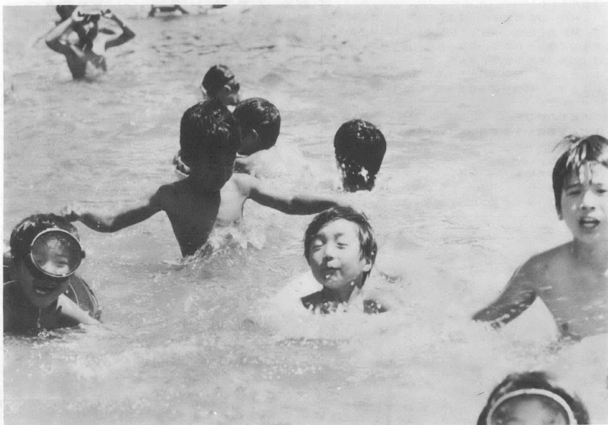
棚橋地内の宮川で