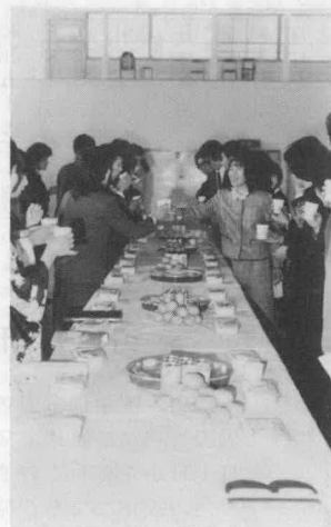
なごやかな立食パーティー

今年の成人者は、度会中学校の第一回卒業生で、企画運営は成人者による実行委員会で行なわれ、とくに服装の簡素化を申し合せた結果、ほとんどの方が洋服で参加されました。