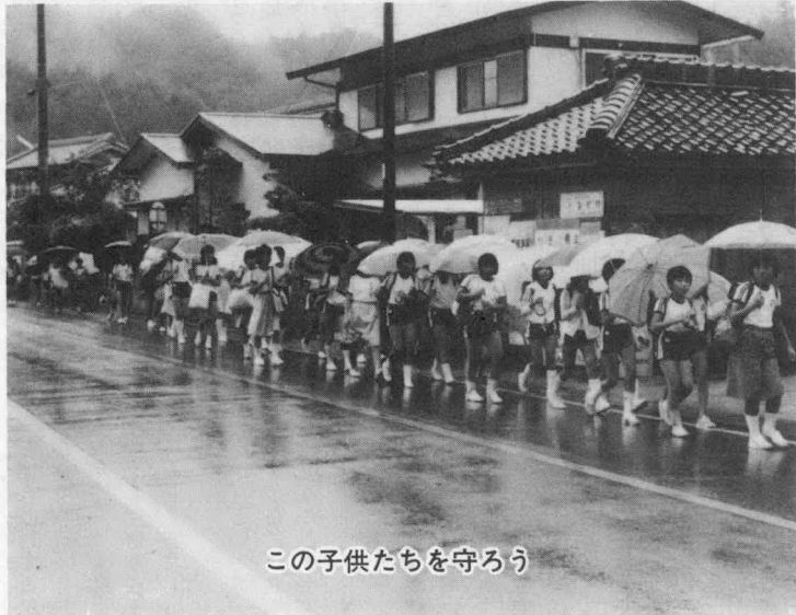
この子供たちを守ろう

家族にもふりかかっています。九月二十一日から三十日まで全国一斉に秋の交通安全運動が実施されています。 この機会に今一度真剣に交通事故防止について取り組もうではありませんか。