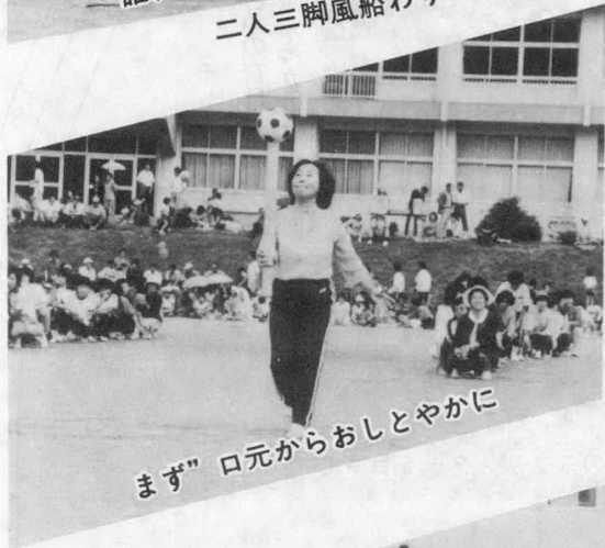
まず”口元からおしとやかに