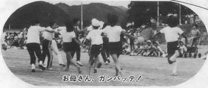
お母さん、ガンバッテ!