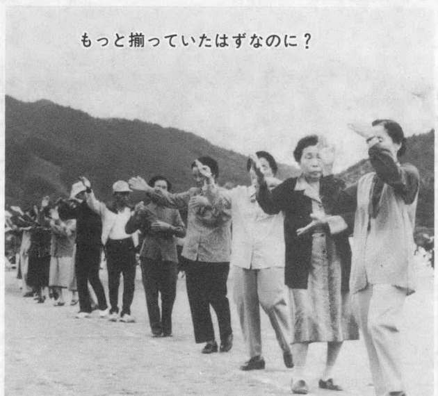
もっと揃っていたはずなのに?