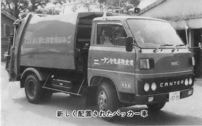
新しく配置されたパッカー車

増加するごみの量と既設炉の能力ダウンから、来年三月の完成を旨として美化センター焼却炉の増設工事に着工しました。