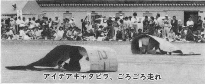
アイデアキャタピラ、ごろごろ走れ