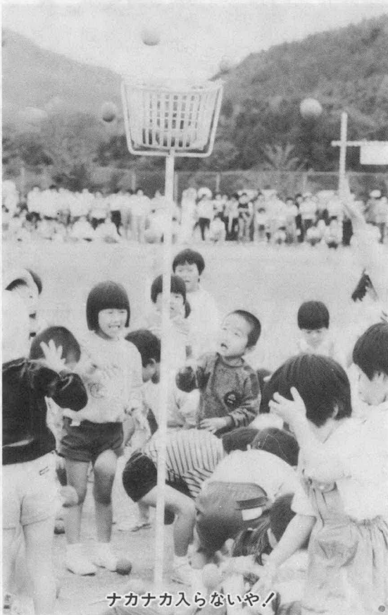
ナカナカ入らないや!