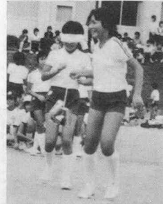
私の音は、どっちかな?