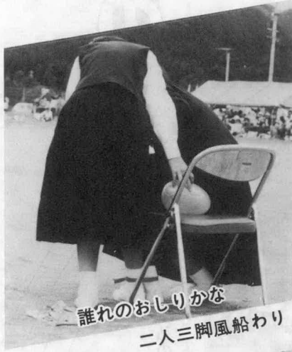
誰れのおしりかな 二人三脚風船わり