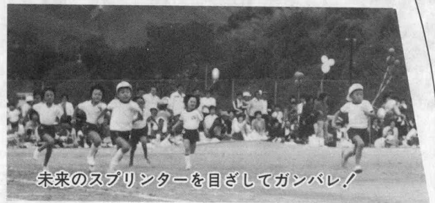
未来のスプリンターを目指してガンバレ!