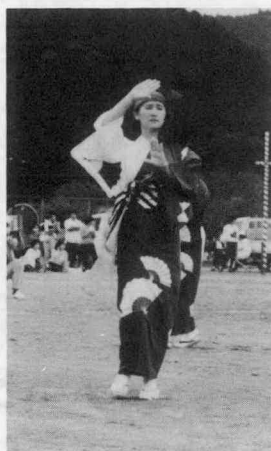
チヨットすまして