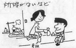
国民年金保険料の手続き