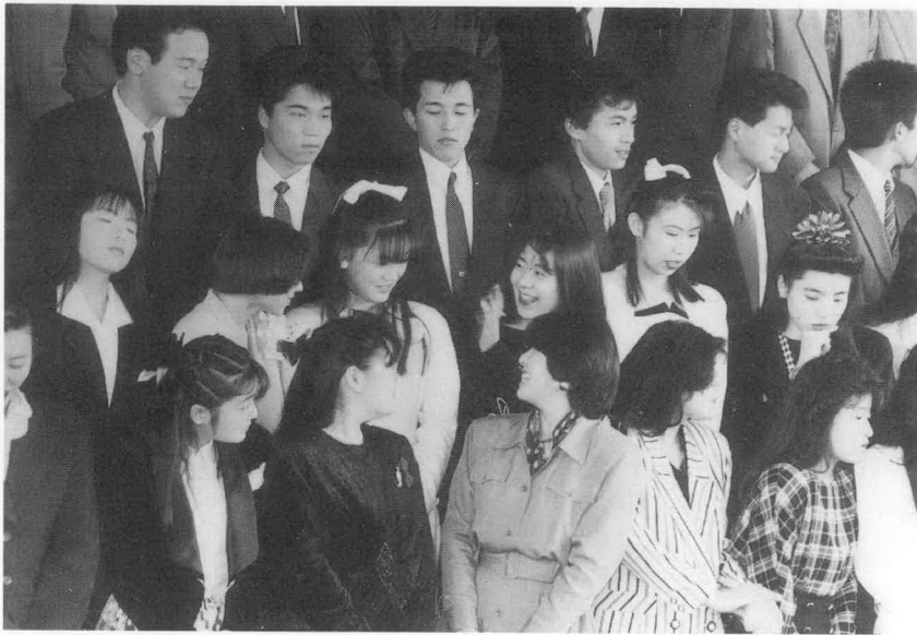
笑顔が輝いています——記念撮影前のひととき

元号が改まって間もなくの一月十五日、度会町では百六名の皆さんが大人の仲間入りをしました。