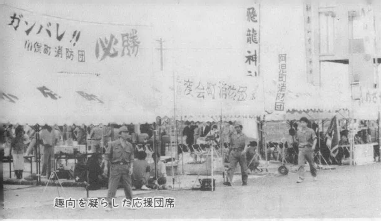
趣向を凝らした応援団席