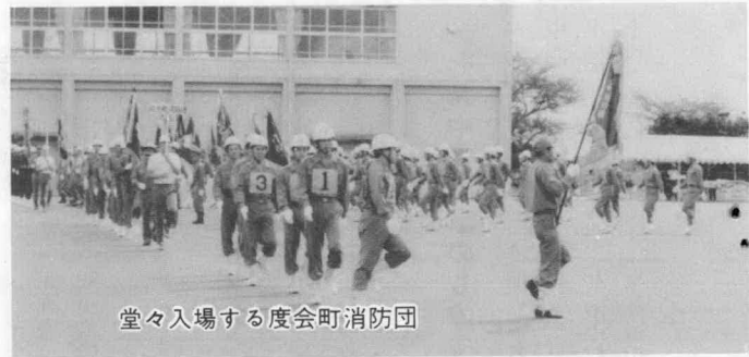
堂々入場する度会町消防団

これら電波障害の相談は、三 重県電波障害防止協議会(電話 〇五九二―二六―二二五)か東 海電気通信監理局(〇五二―九七 一―九六四八)で応じています。