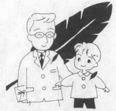
共同募金運動 (10月1日~12月31日)