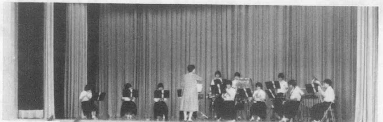
度会中学吹奏楽部の演奏