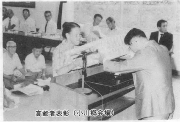
高齢者表彰 (小川郷会場)