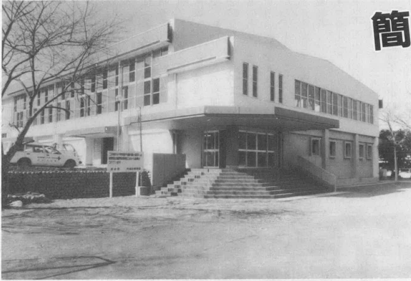
中川小学校 屋内運動場