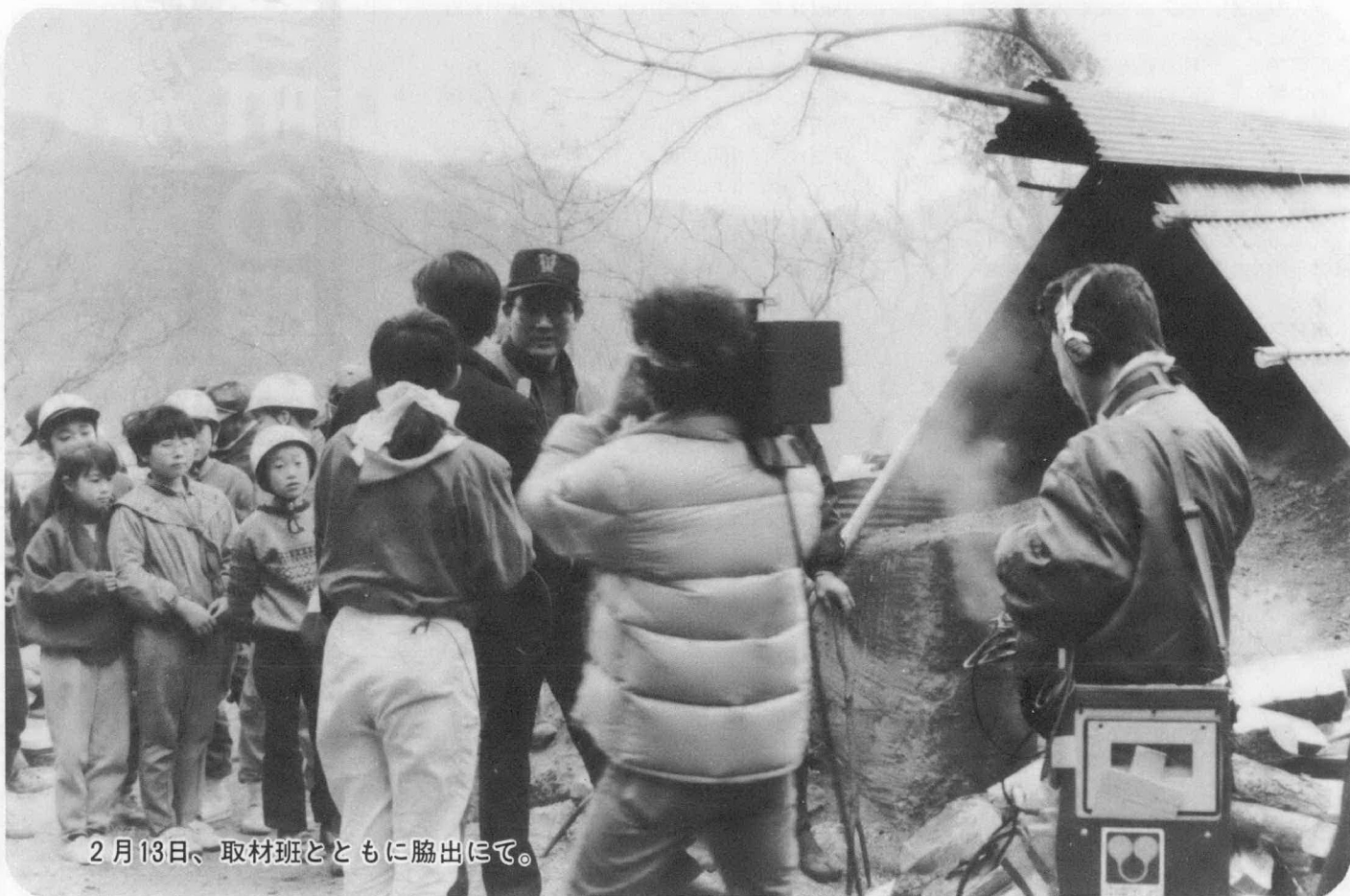
2月13日、取材班とともに協出にて。