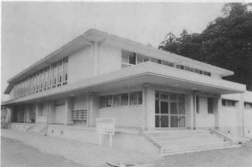
一之瀬小学校 屋内運動場