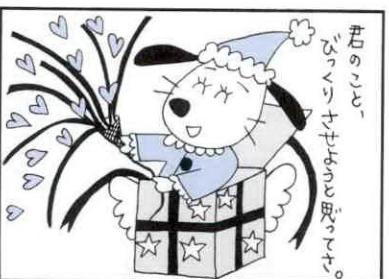
今年もよい年でした。来年も...

平成13年成人式を開催 式典には洋服で参加を 度会町では、1月8日(月)の成人の日に、新しく成人とされる方々を対象に、お祝いの式典を開催します。該当される方々には、町教育委員会から案内状を差し上げます。案内状が届かない場合は、町教育委員会教育課(☎62-1111代)まで、