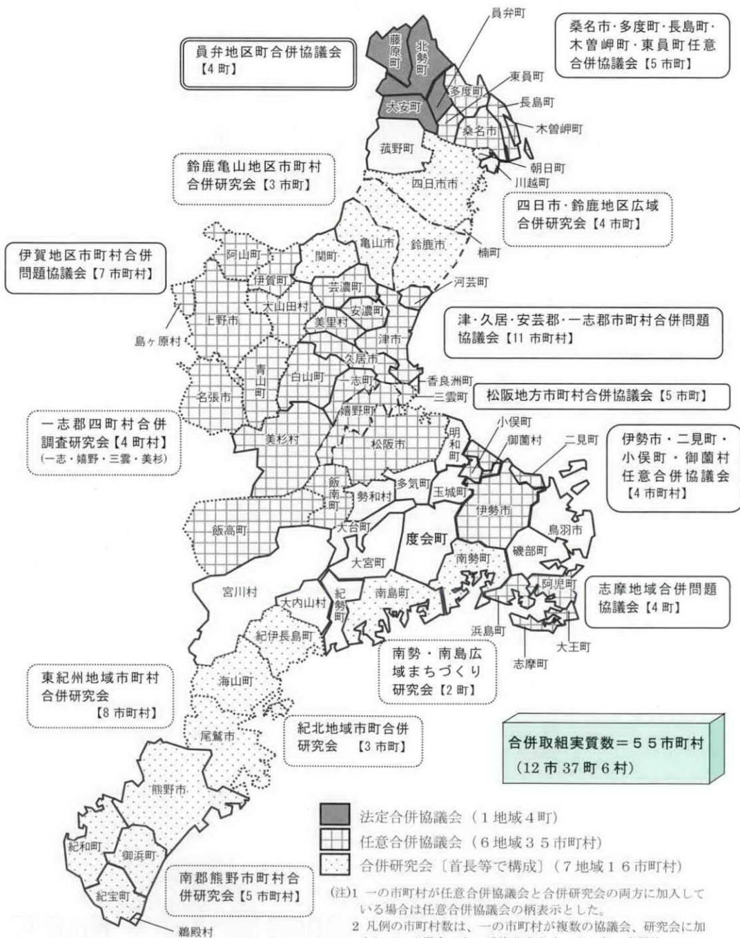
市町村合併に関する取組状況図