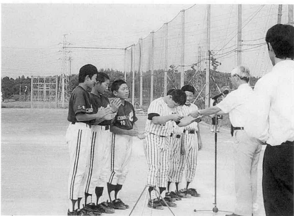
左:一之瀬イーグルス 右:中川スポーツ少年団

今大会で部の主力となり大活躍した3年生は「大会が楽しかった。銀賞も受賞できないと思っていたので驚きました。この金賞はお世話になった先生、先輩方のおかげです。」と、受賞への心境を語るとともに「いい成績を残せるよう、1日1日を大事にして、がんばってください。」と、1・2年生への期待の気持ちを語ってくれました。