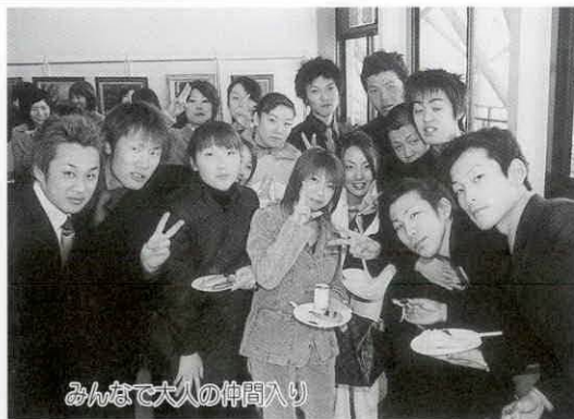
みんなて大人の仲間入り