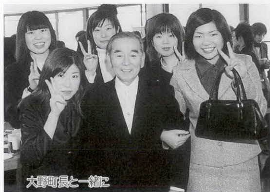
大野町長と一緒に