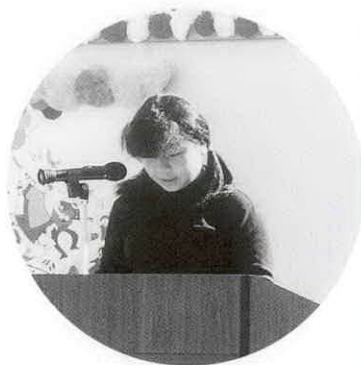
内城田小学校 6年A組