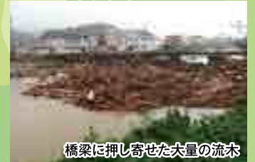
橋梁に押し寄せた大量の流木