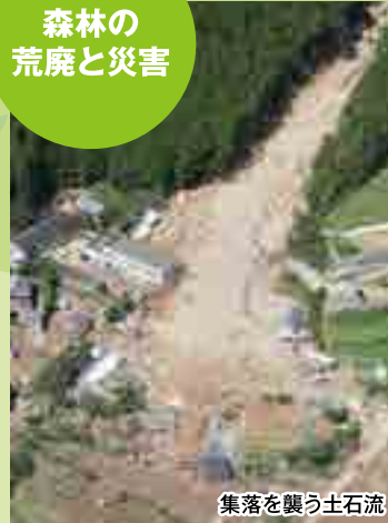
集落を襲う土石流