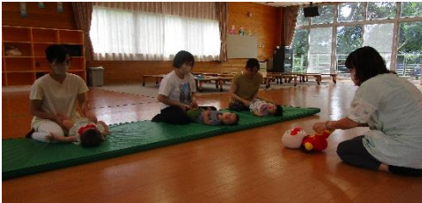
親子でふれあいあそびをしている様子。