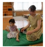
音楽に合わせてマラカスを振ってリズムあそびをしました♪