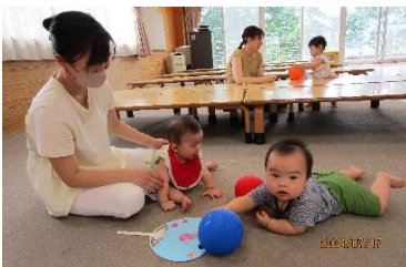
製作したうちわを使った風遊びや、風船をポンポンして遊んでいる様子。