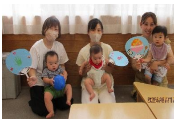
みんなで記念撮影！