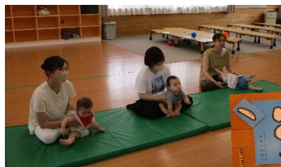
絵本の読み聞かせの様子。紙芝居もしかけがあり、みんな最後まで見てくれました。