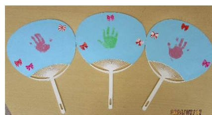
裏面には手形を取りました。