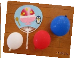
お母さんと一緒に可愛いうちわを完成できました！