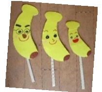
手遊びのバナナのおやこ。