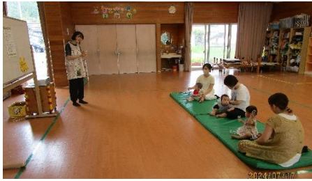
今回は、3組の親子が参加されました。