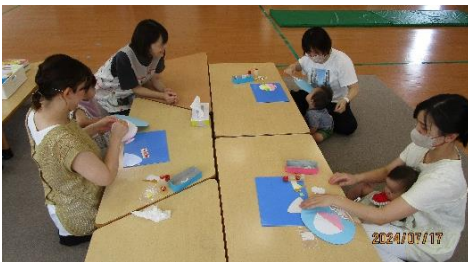
製作あそびでうちわに絵を貼っている様子。