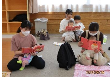
お母さんと赤ちゃんの絵本タイムの様子。みんなじっと絵本をみつめていました。