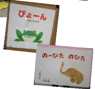
子育てボランティアさんによる絵本の読み聞かせで、「ぴよーん！」と、飛び跳ねていました。