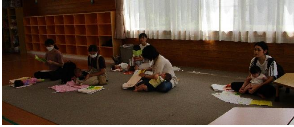
今回は、5組の親子のみなさんが参加して下さいました。