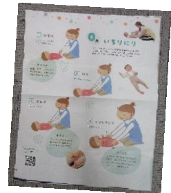
ふれあい遊びもしました。