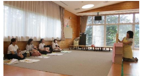
絵本、紙芝居の読み聞かせをしている様子 みんな見てくれていました