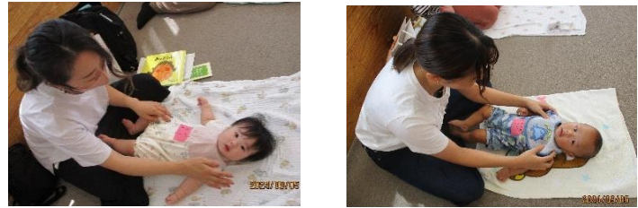
みんな嬉しそうに過ごしていました♪