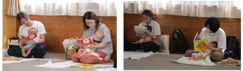
お母さんに絵本を読んでもらっている様子