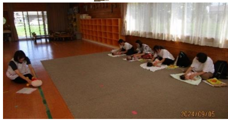
ふれあい遊びをしている様子