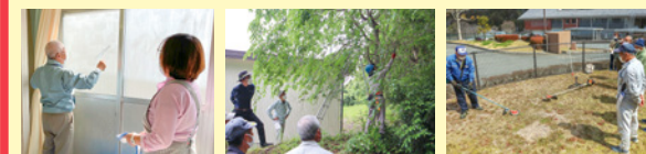
窓ふき講習 枝など剪定講習 草刈り講習

町社会福祉協議会では、隊員の活動をサポートするため、定期的に研修会を開催しています。