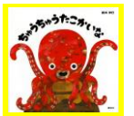
作・絵 新井洋行 講談社

あそびうた風のリズムカルな展開が楽しい絵本。数え歌によって壺の中から現れたのは、たこ。たこが歌うたびにさまざまな「な」のつくものが出てきます。読み聞かせで盛り上がること間違いなしの一冊です。わたっこ広場にもありますので、是非読んでみてください。