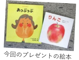
今回のプレゼントの絵本