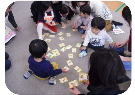
カードゲームをしました!