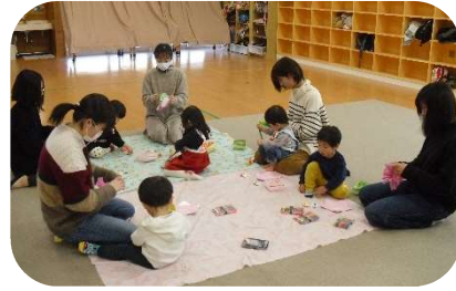
読み聞かせとふれあい遊びを親子で楽しみました♡