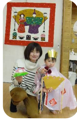
おひな飾りを作って、親子で記念写真を撮りました♪