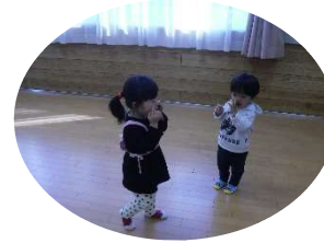
手遊びも上手にできるよ!