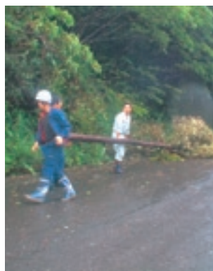
強風により倒れた木か竹。復旧作業に力が注がれる。