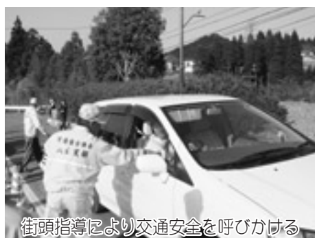
街頭指導により交通安全を呼びかける

人間の幸福は長生きすることです。せっかく親からもらった命。親より一日でも長生きすることはもちろん、平均寿命より一日でも長生したいものです。