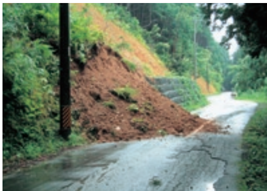
恐ろしい土砂崩れ。道路は安全のため通行止めとなる。