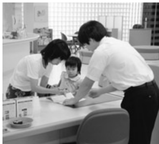
手続きは役場健康福祉課で

該当される方は、次の事項に従って申請手続きを行ってください。特例措置により、4月分（4月1日以降下記に該当した人についてはその翌月から）から支給されます。