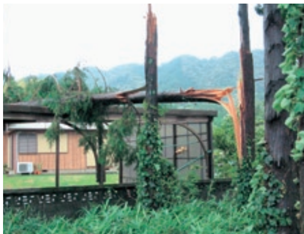
家屋へ倒れる木。災害は山や道路だけでなく、どこで発生するかわからない。