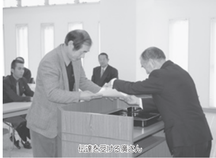
伝達を受ける廣さん