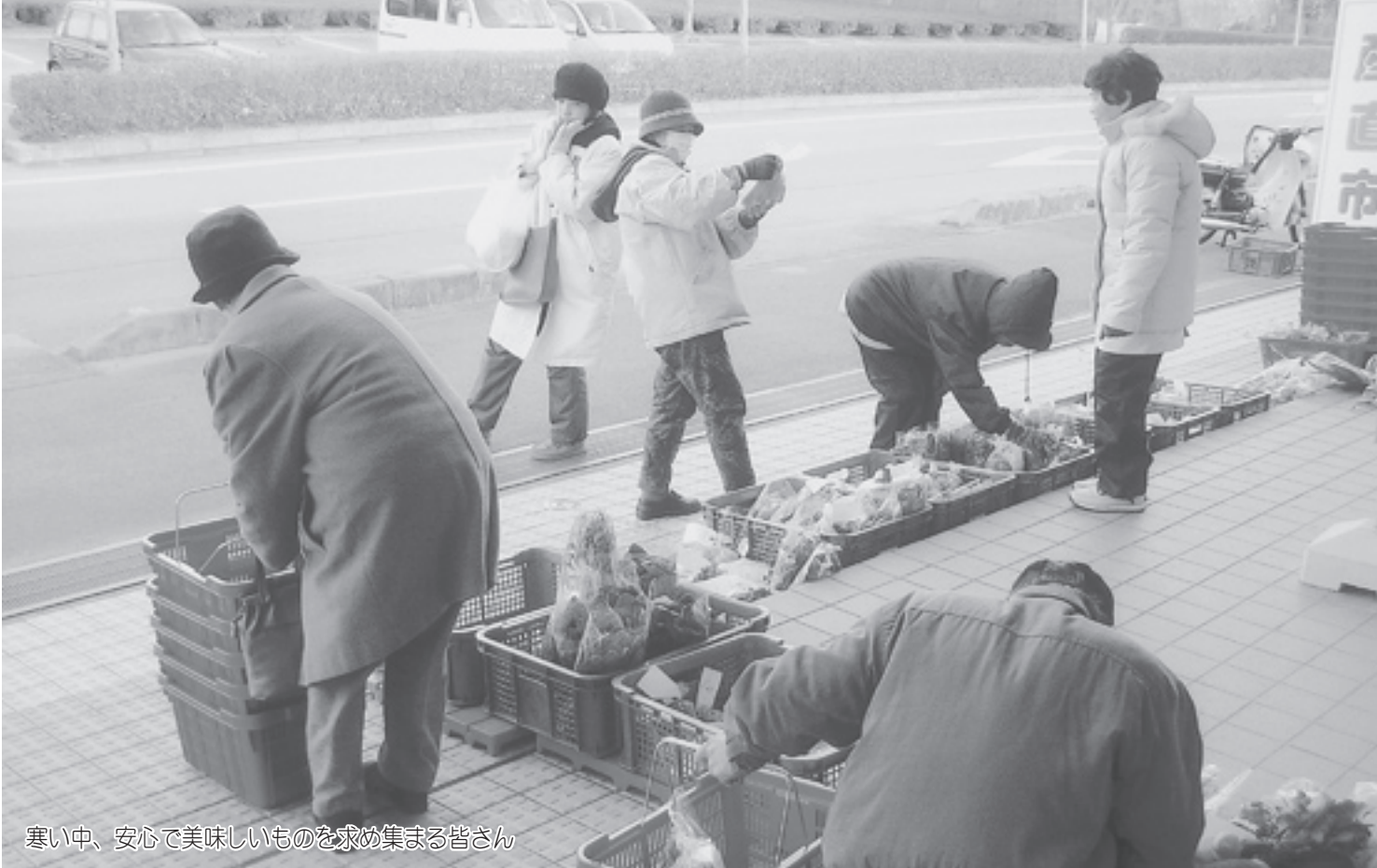
寒い中、安心して美味しいものを求め集まる皆さん