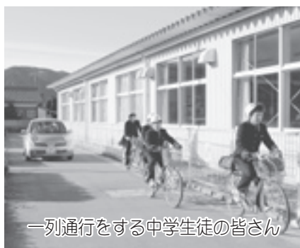
一列通行をする中学生徒の皆さん

には、一旦停止して、歩行者の妨害をしないようにしましょう。 ④夕方、薄暗くなってきたら、早めにライトをつけて、周囲に自転車の存在を知らせることも大切です。