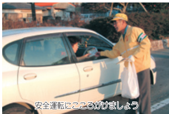
安全運転にこころがけましょう