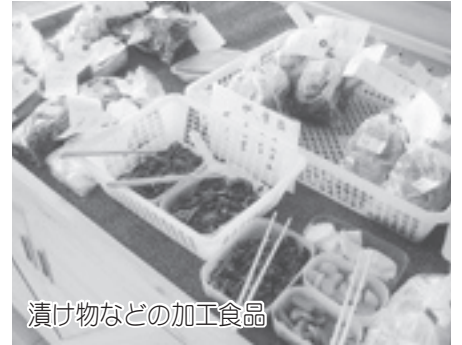
漬け物などの加工食品

また、地元で生産された食 材を使い、手作りを勧める講 習会を開催するなど、伝統的 な食材など質の良い食品を守 り、消費者のさまざまな味へ