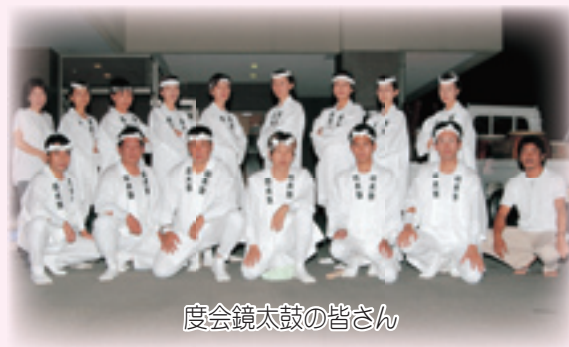
度会鏡太鼓の皆さん

会場内では、各種共催・協賛団体の模擬店や小イベント、一般参加のフリーマーケットをはじめ、ジャズや二胡、度会中学校吹奏楽部の演奏、度会鏡太鼓と玉丸城太鼓の共演など、楽しいステージ