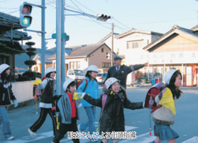
駐在さんによる街頭指導