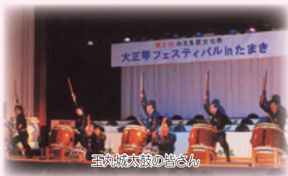
玉丸城太鼓の皆さん

イベントを展開します。フィナーレにはもちまき大会と盛りだくさんの内容でいっぱいです。