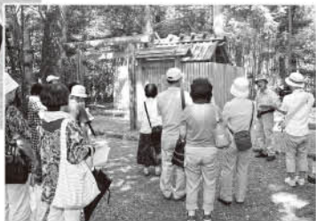
宮川流域ミニツアーで▶ 久具都比売神社を参拝