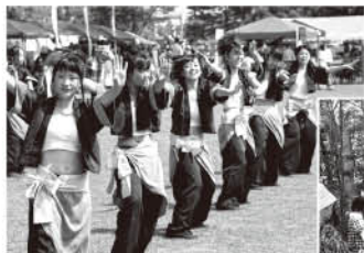
◀ステージを飛び出し、 よさこいソーランを披露

参加者は「町内に住んでいるが、初めて知ったこともあってとても楽しかった」と話していました。