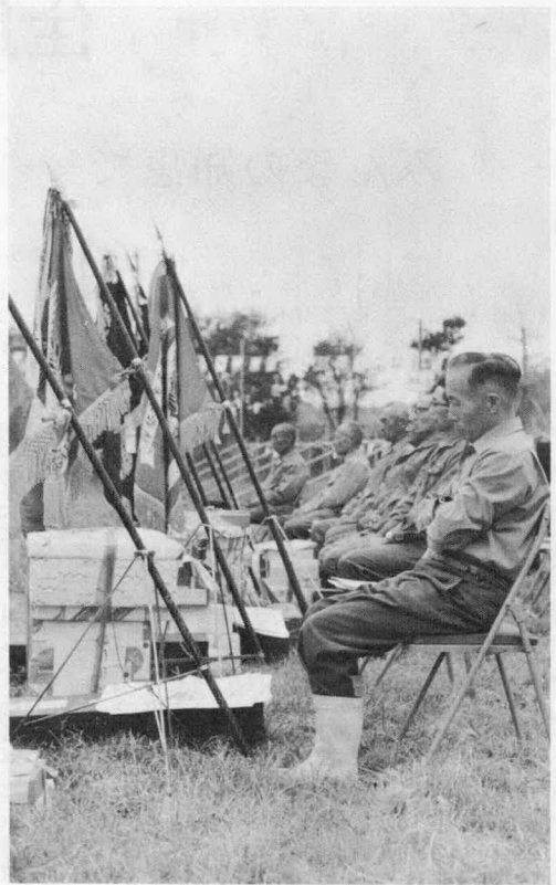
畜産共進会で晴れの優等に輝いた方々

第十回伊勢志摩畜産共進会 (伊勢市、度会郡度会町、御 菌村、志摩郡磯部町などで組 織)は去る十月十七日伊勢市 の県営体育館広場で開かれま した。 各農家が愛情と手塩にかけ て育てた約八〇頭が出品され 盛況のうちに行なわれました。 この結果つぎの方々が入賞 されました。