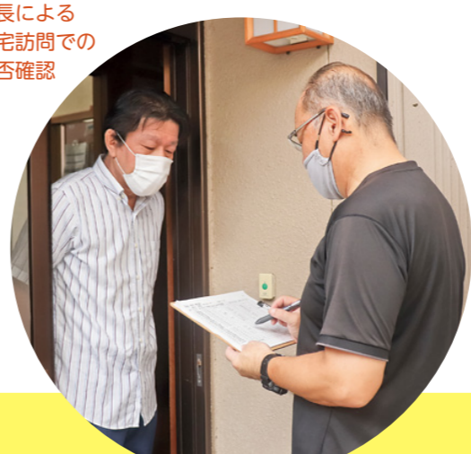
班長による 自宅訪問での 安否確認

今回は、新型コロナウイルス感染症予防のため、一時避難所への参集を避け、安否確認中心の防災訓練としました。安否確認は、各班の班長、副班長、区の方が全ての家を訪問する ことで行いました。皆さんの協力もあって、今回の方法で、安否確認という目的を達成することができました。今後、さらに良いやり方がないか、皆で試行錯誤していきたいです。