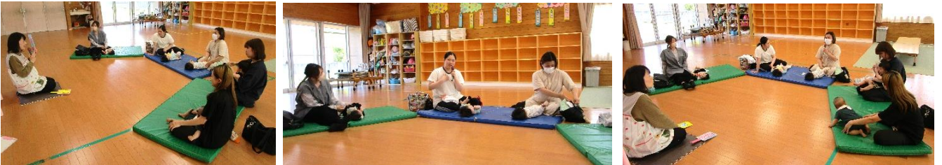
お母さんのおしゃべり交流会を開催！3つのお題に沿って皆でお話をしました。お母さん達の笑顔で話される姿が印象的でした。