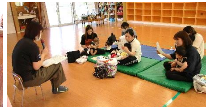
保健師によるミニ講話の様子。