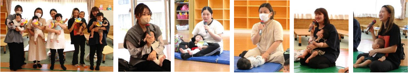
5月のわたっこBabyひろばは、5組の親子が参加されました。自己紹介では、お子さんの近況をお話してもらいました。