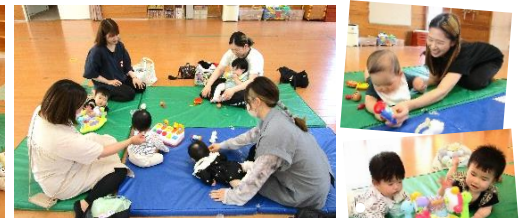
親子同士の交流タイムの様子。