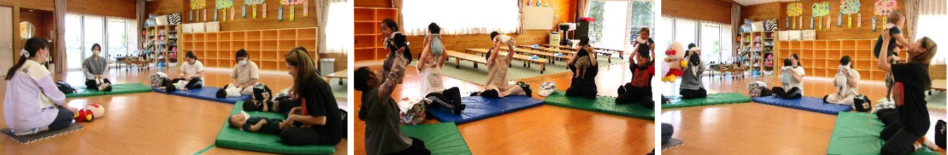
親子でふれあい遊びをしている様子。わらべうたの紹介を兼ねて新しい曲に挑戦し、皆さん上手に触れ合っていました。