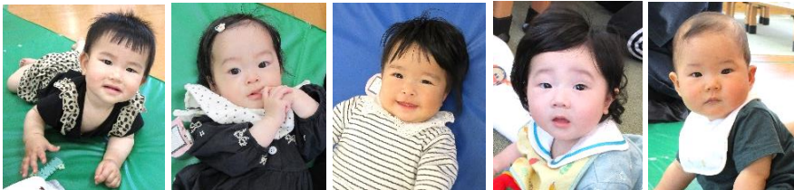
お母さんのとなりでござげんな赤ちゃん達でした。