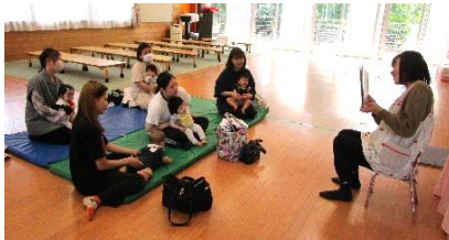
保育士による紙芝居の読み聞かせの様子。