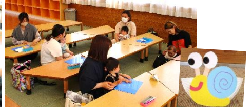
製作あそびで「かたつむり」を作りました。