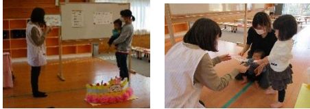
1歳のお誕生日証書の授与をしました。 みんな大きくなったね♡