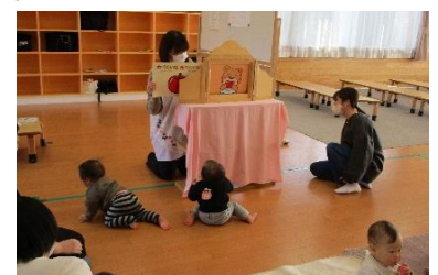
紙芝居の読み聞かせを楽しんでいる様子。

今回のわたっこBabyひろばは、8組の親子のみなさんが、参加されました。みなさん楽しく和気あいあいと会話され、とても良い雰囲気でした。製作あそびの「手形・足型アート」では、みなさん上手にスタンプで手形・足型がとれていて、良い記念になったと保護者の方々も喜んで下さいました。ふれあいあそびを楽しみ、季節の歌を振り付け付きで一緒に歌ったり、みなさんと楽しい時間を過ごせて良かったです♡