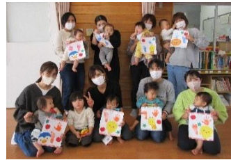
製作あそび「手形・足型アート」を製作している様子。みんな頑張って手形・足型をとりました！記念にみんなで撮影。