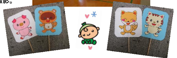
ペープサートで「こぶたぬきつねこ」の手遊びをしている様子。