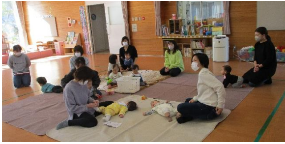
今回は、8組の親子のみなさんが参加して下さいました。