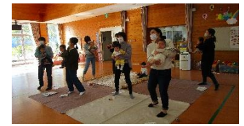
ふれあいあそびと季節の歌を歌いながらお母さんとゆらゆらしている様子。