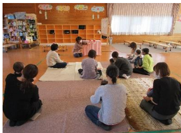
絵本の読み聞かせを楽しんでいる様子。