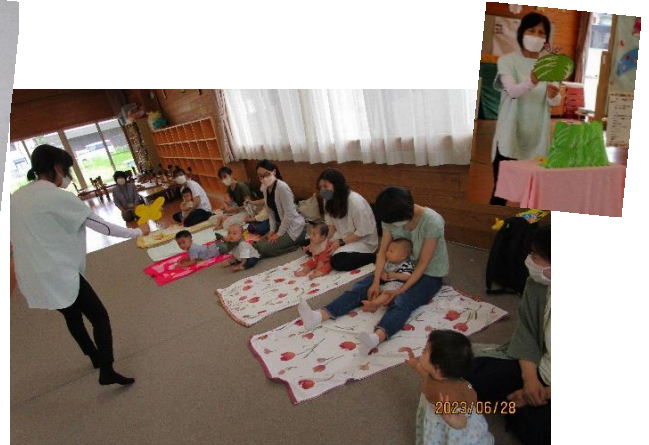
お母さんと「キャベツの中から」の手遊びをして、遊んでいる様子。