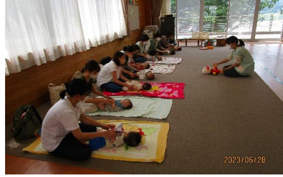
ふれあい遊びをしている様子！ お母さんに手足を動かしてもらい、楽しそうな子ども達。