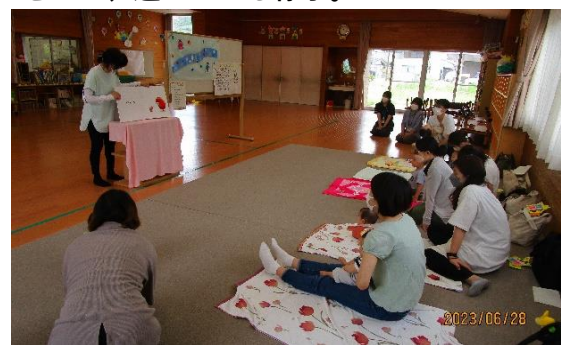
絵本を読み聞かせの時の様子。