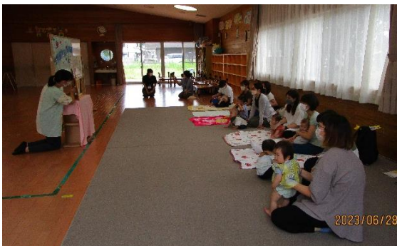
紙芝居の読み聞かせの時の様子。