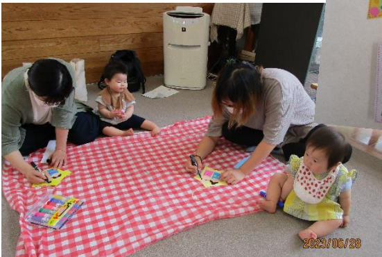
製作あそびで「織姫と彦星の短冊」を作製中！