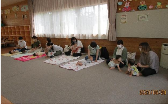
今回は、8組の親子のみなさんが参加して下さいました。