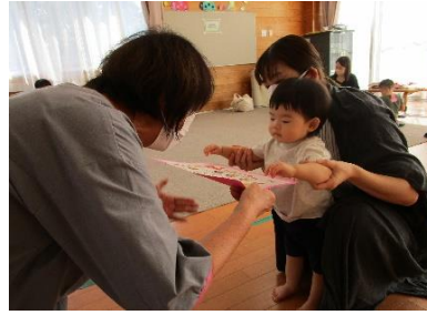
1歳のお誕生日おめでとう証書授与している様子。 わたっこBabyひろばは、卒業です。大きくなったね♡