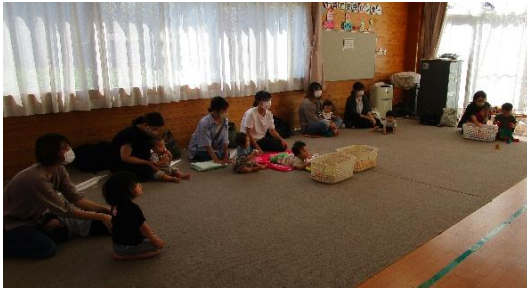
今回は、8組の親子のみなさんが参加して下さいました。