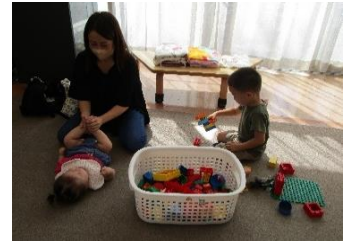
ふれあい遊びをしている様子！お母さんに手足を動かしてもらい、楽しまれていました。