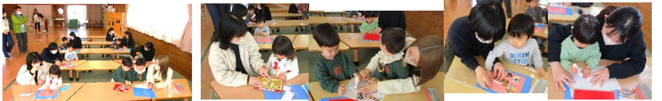
製作あそび「思い出アート」を製作中の様子。子ども達は、上手にのりで思い出の写真を貼っていました。