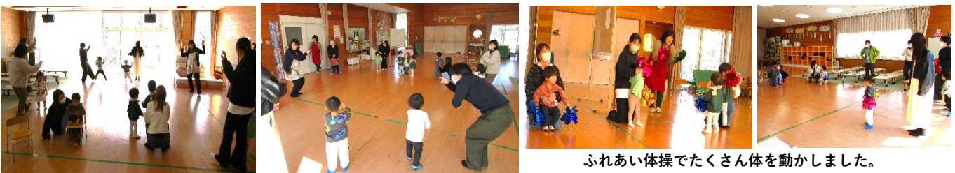
ふれあい体操でたくさん体を動かしました。