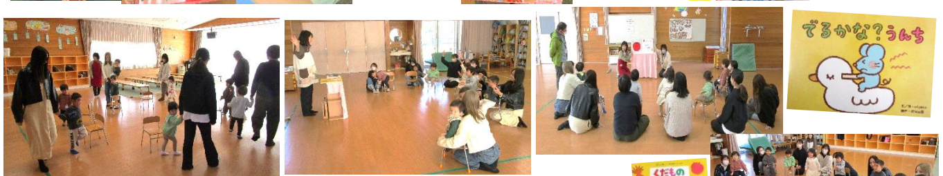
集団あそび「椅子取りゲーム」の様子。 音楽に合わせてたくさん歩きました。