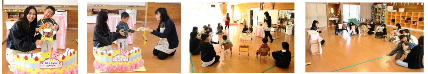
お誕生日のお友だちをみんなでハッピーバースデーを歌ってお祝いしました♪ ミニ講話では「挨拶の大切さ」をお話しました。