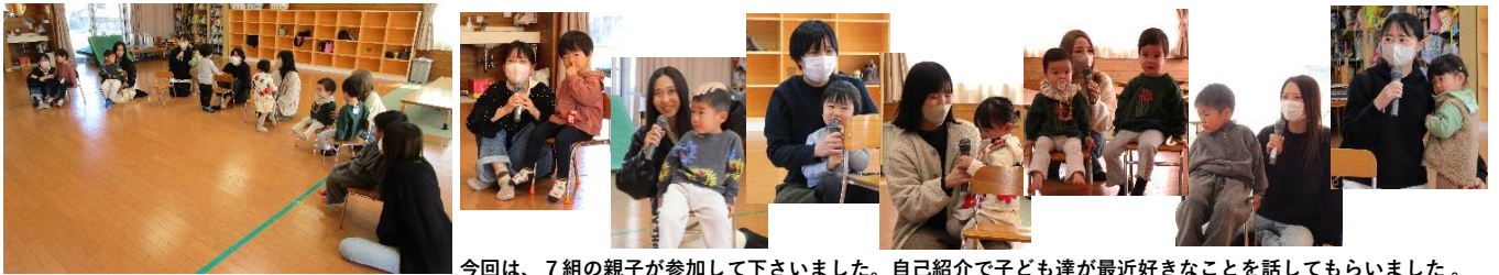
今回は、7組の親子が参加して下さいました。自己紹介で子ども達が最近好きなことを話してもらいました。