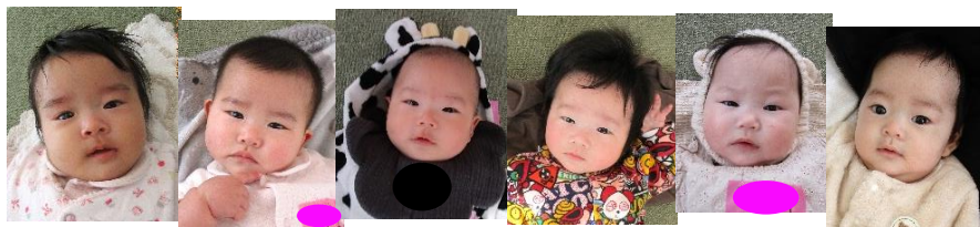
♡今回、参加してくれた可愛いBabyたちです♡